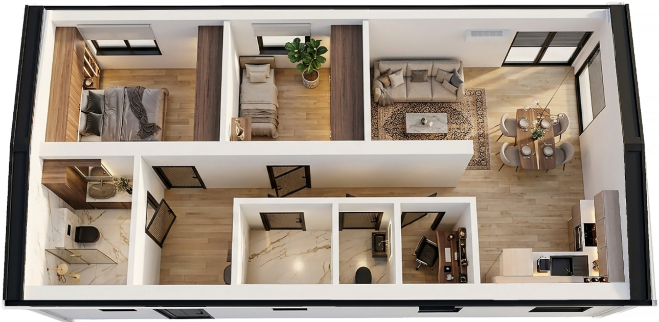
3D-Visualisierung des Innenraums. Möblierung zur Veranschaulichung.

Unverbindliche Preisschätzung · Alle Preise inkl. 19 % MwSt. und Transport deutschlandweit (außer Inseln)