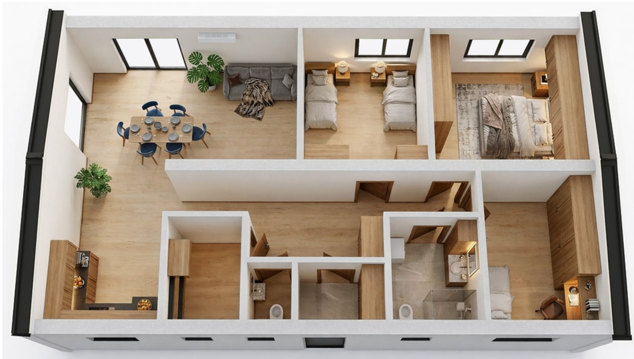
3D-Visualisierung des Innenraums. Möblierung zur Veranschaulichung.

Unverbindliche Preisschätzung · Alle Preise inkl. 19 % MwSt. und Transport deutschlandweit (außer Inseln)