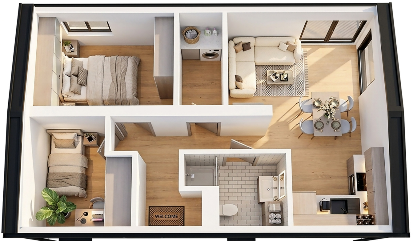
3D-Visualisierung des Innenraums. Möblierung zur Veranschaulichung.

Unverbindliche Preisschätzung · Alle Preise inkl. 19 % MwSt. und Transport deutschlandweit (außer Inseln)