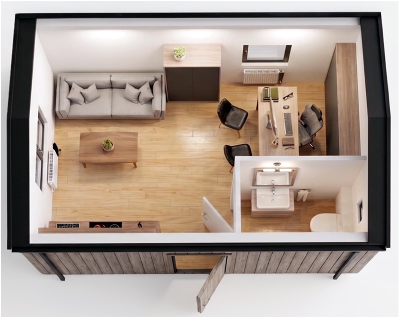
3D-Visualisierung des Innenraums. Möblierung zur Veranschaulichung.