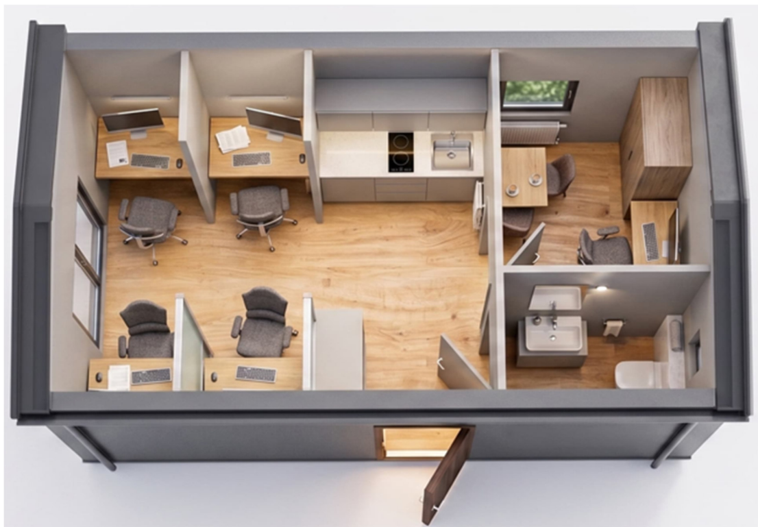
3D-Visualisierung des Innenraums. Möblierung zur Veranschaulichung.