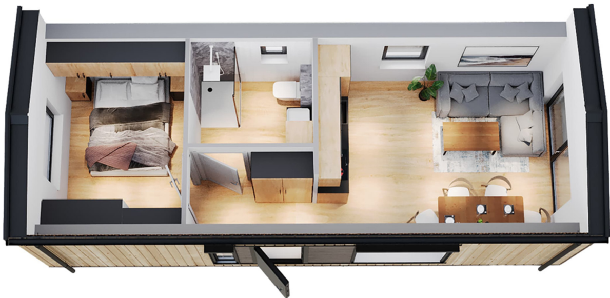
3D-Visualisierung des Innenraums. Möblierung zur Veranschaulichung.

Unverbindliche Preisschätzung · Alle Preise inkl. 19 % MwSt. und Transport deutschlandweit (außer Inseln)