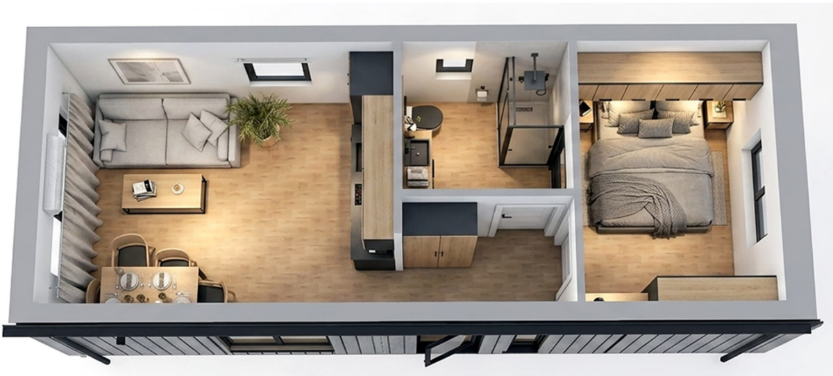
3D-Visualisierung des Innenraums. Möblierung zur Veranschaulichung.