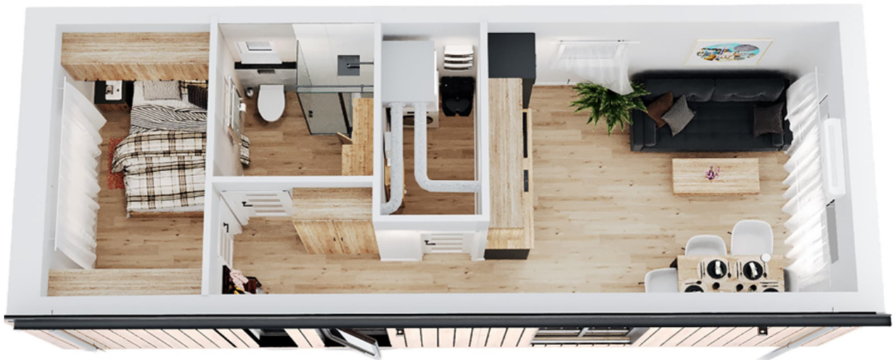
3D-Visualisierung des Innenraums. Möblierung zur Veranschaulichung.

Unverbindliche Preisschätzung · Alle Preise inkl. 19 % MwSt. und Transport deutschlandweit (außer Inseln)