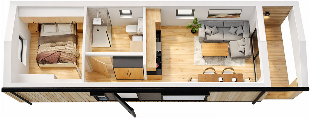
3D-Visualisierung des Innenraums. Möblierung zur Veranschaulichung.