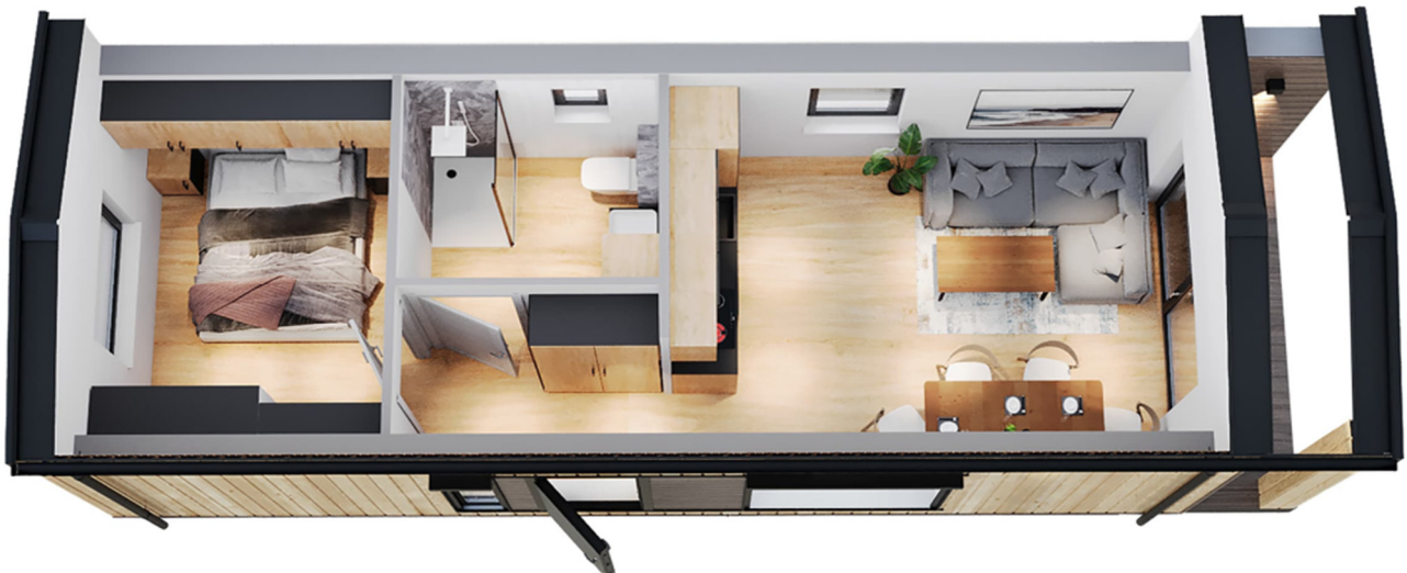
3D-Visualisierung des Innenraums. Möblierung zur Veranschaulichung.

Unverbindliche Preisschätzung · Alle Preise inkl. 19 % MwSt. und Transport deutschlandweit (außer Inseln)