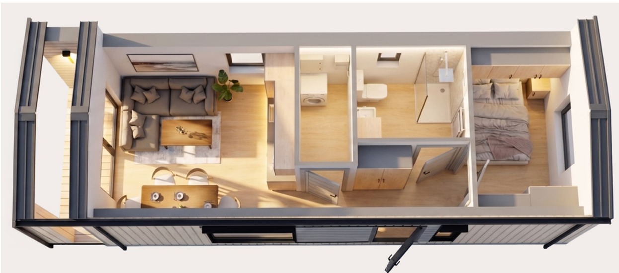
3D-Visualisierung des Innenraums. Möblierung zur Veranschaulichung.

Unverbindliche Preisschätzung · Alle Preise inkl. 19 % MwSt. und Transport deutschlandweit (außer Inseln)