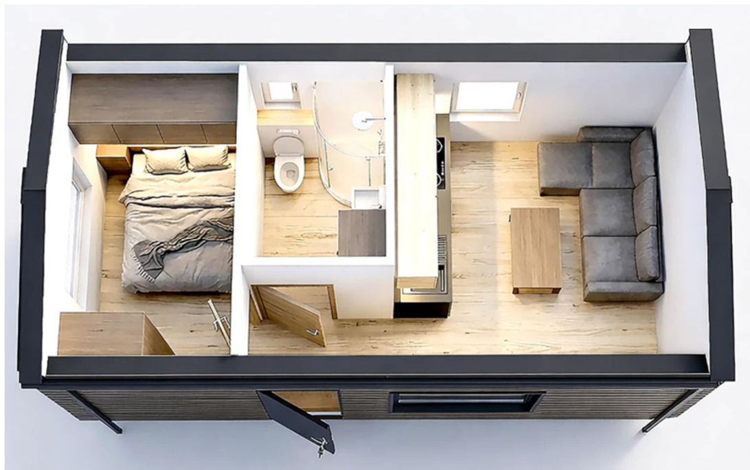
3D-Visualisierung des Innenraums. Möblierung zur Veranschaulichung.

Unverbindliche Preisschätzung · Alle Preise inkl. 19 % MwSt. und Transport deutschlandweit (außer Inseln) Haus MW24 bietet auf 24,5 m 2 Grundfläche im GEG Standard ein kompaktes, altersgerechtes