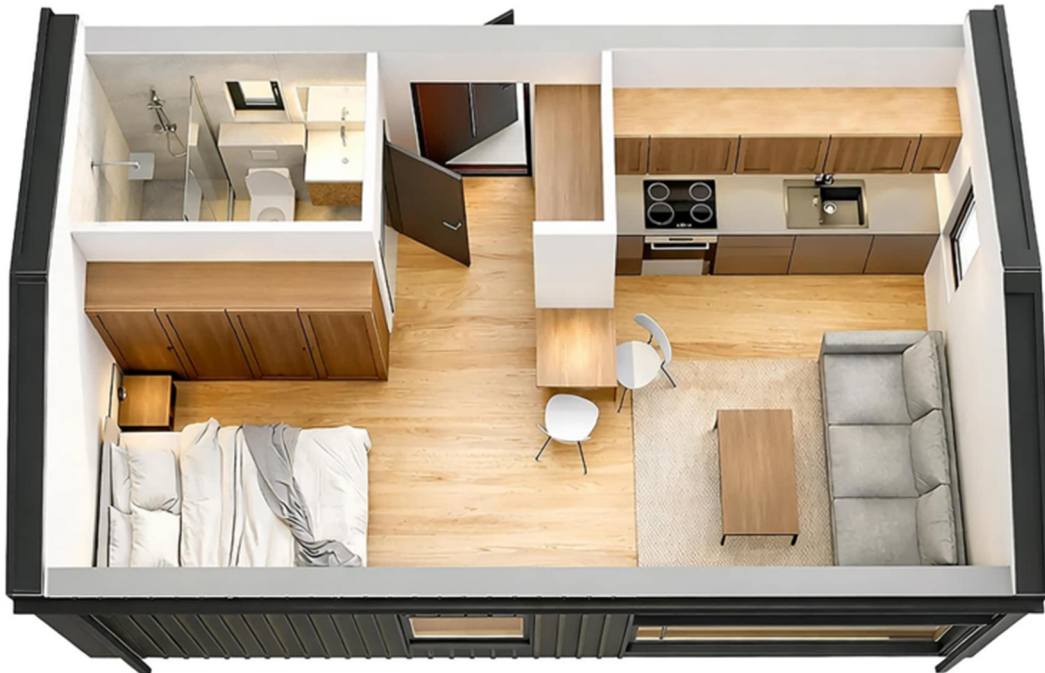
3D-Visualisierung des Innenraums. Möblierung zur Veranschaulichung.

Unverbindliche Preisschätzung · Alle Preise inkl. 19 % MwSt. und Transport deutschlandweit (außer Inseln)