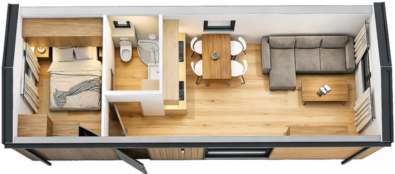
3D-Visualisierung des Innenraums. Möblierung zur Veranschaulichung.

Unverbindliche Preisschätzung · Alle Preise inkl. 19 % MwSt. und Transport deutschlandweit (außer Inseln)