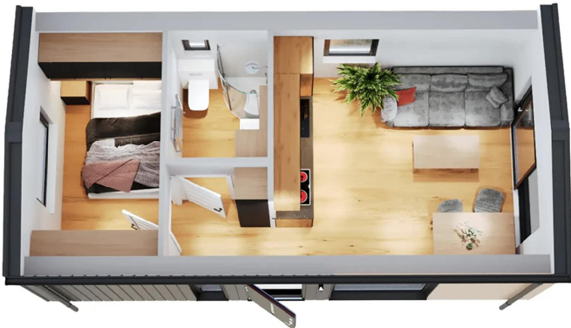
3D-Visualisierung des Innenraums. Möblierung zur Veranschaulichung.

Unverbindliche Preisschätzung · Alle Preise inkl. 19 % MwSt. und Transport deutschlandweit (außer Inseln)