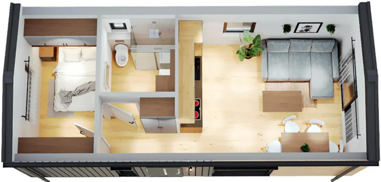
3D-Visualisierung des Innenraums. Möblierung zur Veranschaulichung.

Unverbindliche Preisschätzung · Alle Preise inkl. 19 % MwSt. und Transport deutschlandweit (außer Inseln)