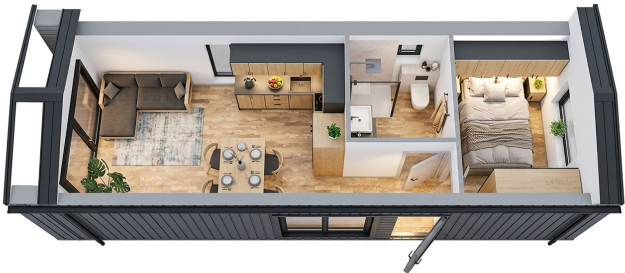
3D-Visualisierung des Innenraums. Möblierung zur Veranschaulichung.

Unverbindliche Preisschätzung · Alle Preise inkl. 19 % MwSt. und Transport deutschlandweit (außer Inseln)