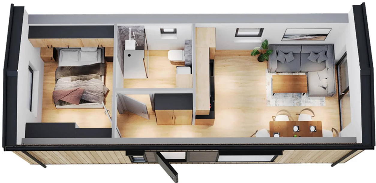
3D-Visualisierung des Innenraums. Möblierung zur Veranschaulichung.

Unverbindliche Preisschätzung · Alle Preise inkl. 19 % MwSt. und Transport deutschlandweit (außer Inseln)