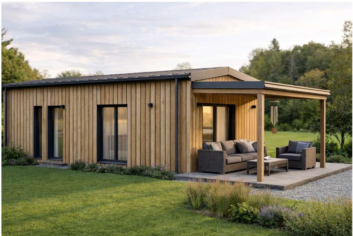
KI-gestützte Visualisierung Abbildungen: KI-gestützte Visualisierungen. Details siehe Impressum