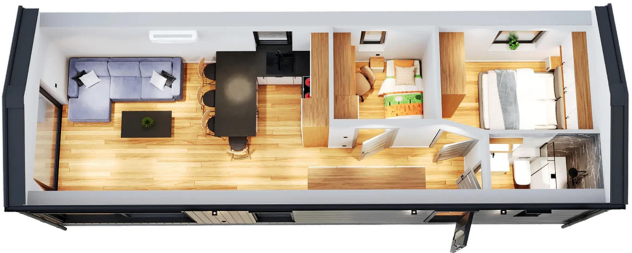
3D-Visualisierung des Innenraums. Möblierung zur Veranschaulichung.

Unverbindliche Preisschätzung · Alle Preise inkl. 19 % MwSt. und Transport deutschlandweit (außer Inseln)