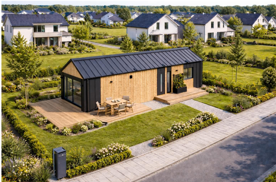
Abbildungen: KI-gestützte Visualisierungen. Details siehe Impressum