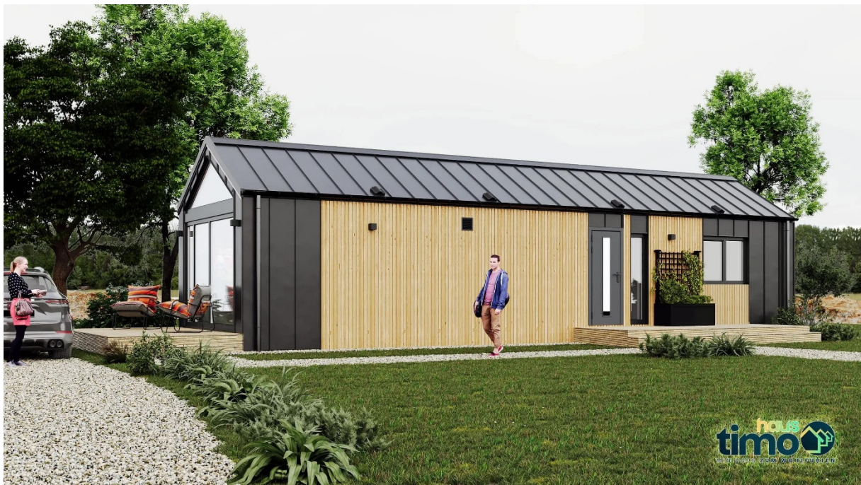
Foto: TIMO Haus