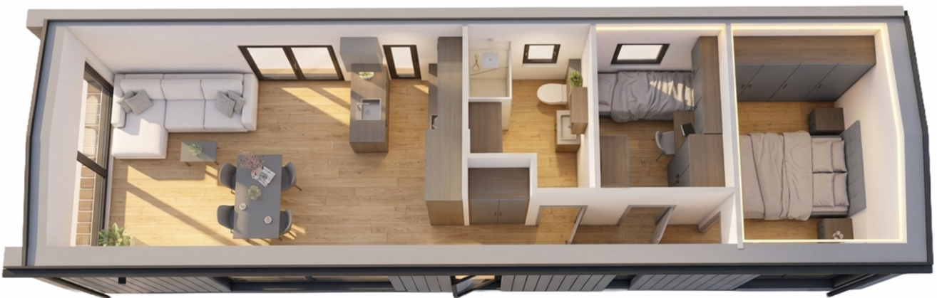
3D-Visualisierung des Innenraums. Möblierung zur Veranschaulichung.

Unverbindliche Preisschätzung · Alle Preise inkl. 19 % MwSt. und Transport deutschlandweit (außer Inseln)